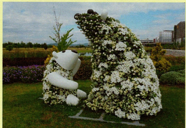
▲昨年夏のトピアリー

日時：6月18日（土）10：00～12：00 場所：北彩都ガーデン ガーデンセンター集合 ・参加無料（当日参加可能） ・動きやすい服装 ・グローブ（貸し出し可能） 申し込み：5月21日（土）から TEL 74-5966