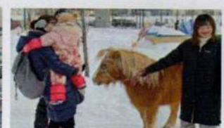
🐾旭川乗馬倶楽部 ポニーとウサギに触れて癒されました。