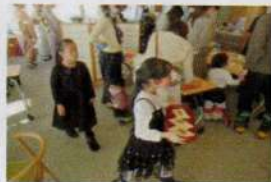
🍵長野社中：振舞い呈茶 お抹茶でほっこり