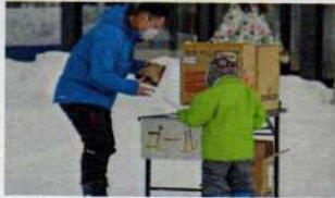
🐿️周遊クイズラン 隠れたキーワード、上手く探し出せたかな？