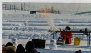
🧪爆寒・外DE実験タイム 燃えているのに熱くない？ 不思議な化学実験ショー